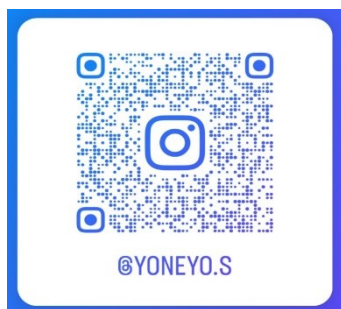
👉 就労コースインスタグラム