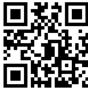
👉 本校ホームページ