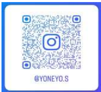
👉 就労コースインスタグラム