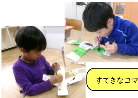
すてきなコマを作ったよ！