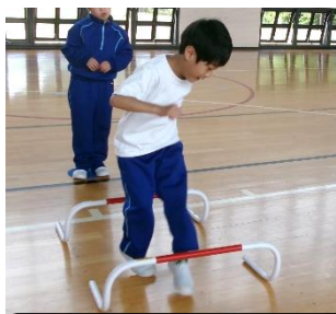
ハードルコースにチャレンジ！

また、生活単元学習「はるをたのしもう」では、はるさがしピンゴカードを使って春探しをしたり、好きな遊具で遊んだりしました。天気の悪い日には、牛乳パックでコマを作りました。みんな集中して取り組むことができました！