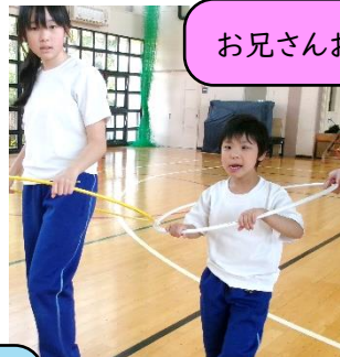
お兄さんお姉さんと、ペアリレー！